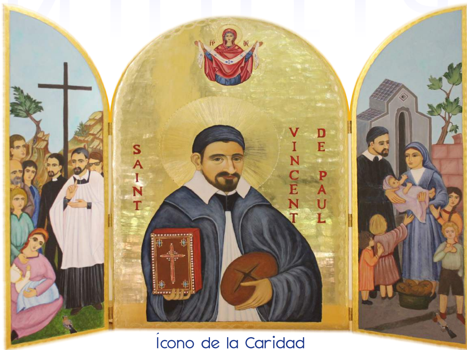
Ícono de la Caridad