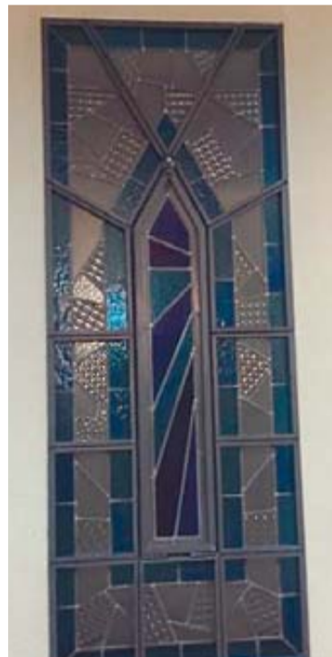
Vidriera en forma de Obelisco del colegio María Inmaculada.