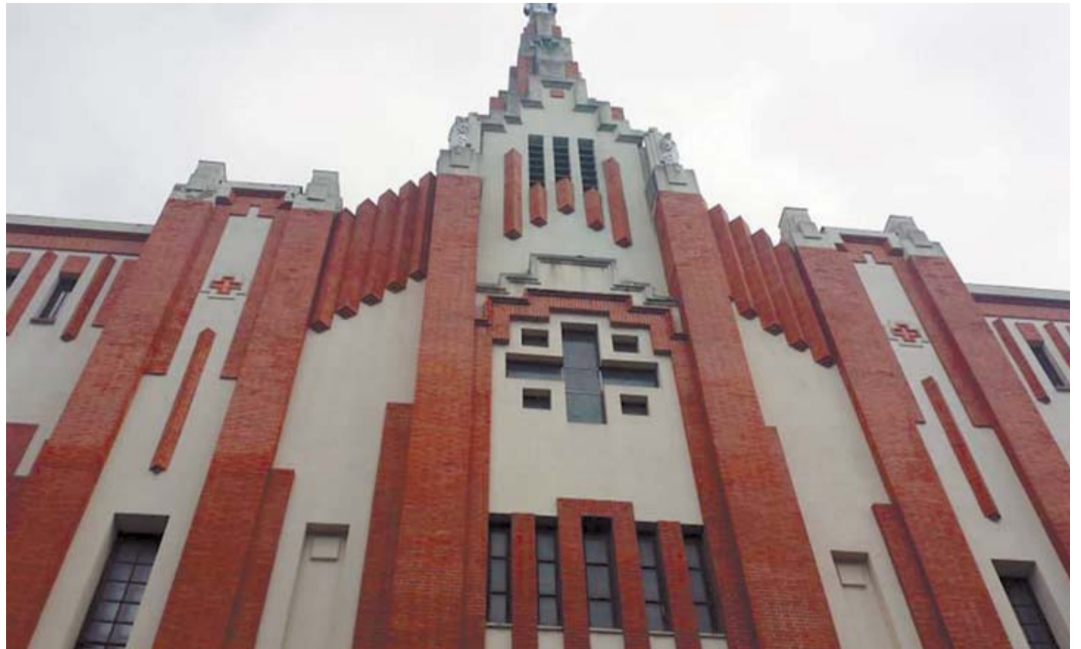
Fachada de los Paules con la cruz.

En 1922 se descubre la tumba de Tutanjamón y España como el resto del mundo queda fascinada por el enorme hallazgo. Las grandes peregrinaciones hispano-americanas de los años 24, 25 y 26 promovidas por el obispo de Vitoria y el cuerpo diplomático