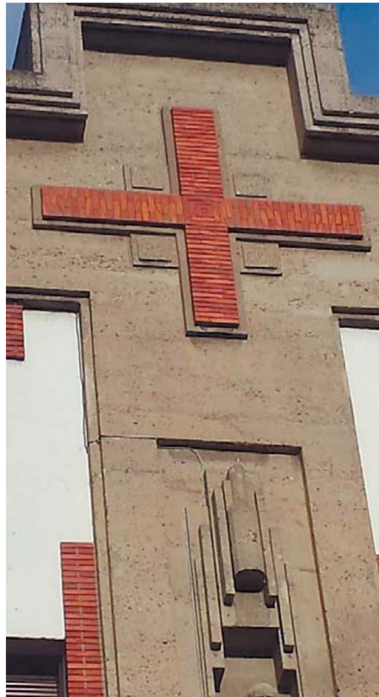
Cruz en la fachada de Escolapios de Pamplona.