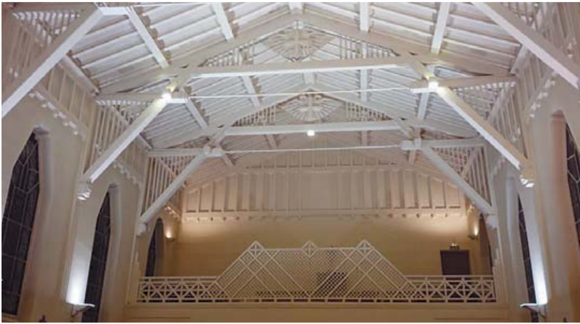
Techo y coro de la capilla de María Inmaculada.