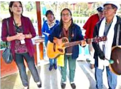
Arriba: Canciones tradicionales disfrutadas por los participantes.