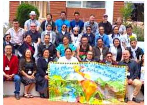
Arriba: Los asistentes pasan para las fotos que se añadirán al libro conmemorativo del evento.