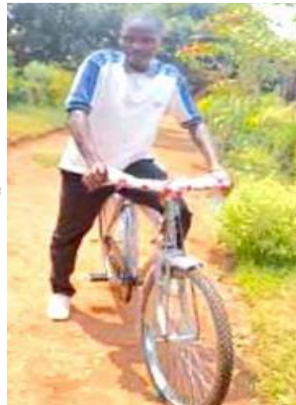
Abajo: Recogida, transporte y distribución de bicicletas en la misión y el campo de refugiados de Mahama, Ruanda.