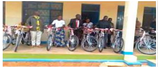
Arriba y a la izquierda: Recogida y distribución de bicicletas en la parroquia de Rwisabi, Burundi.

La región tiene previsto colaborar con los que recibieron las bicicletas para formar un grupo de solidaridad que será gestionado por comités. Estos grupos se encargarán del mantenimiento adecuado de las bicicletas para maximizar su uso. Además trabajarán con el fin de recaudar fondos para comprar nuevas bicicletas para otros miembros de la comunidad que aún están esperando una.