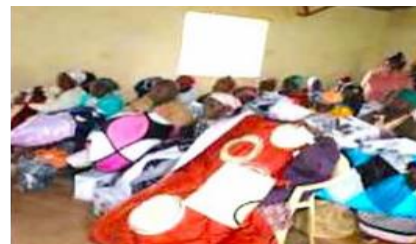
Izquierda: Beneficiarios con los artículos del proyecto: mantas, efectos personales, estufa y lámpara.

bajo consumo, así como mantas y paquetes de higiene personal. Además, mediante la creación de grupos más pequeños de personas de la misma edad y la organización de reuniones sociales, el proyecto está rompiendo el ciclo de soledad que tan a menudo acompaña a la vejez en las zonas rurales. Estas reuniones permiten a las personas mayores compartir sus experiencias y encontrar apoyo psicosocial entre compañeros que comprenden sus cargas únicas. Junto con el suministro de iluminación solar y paquetes de cuidados esenciales, estas redes sociales empoderan a nuestros mayores para que lleven una vida definida por la dignidad en lugar de la supervivencia.