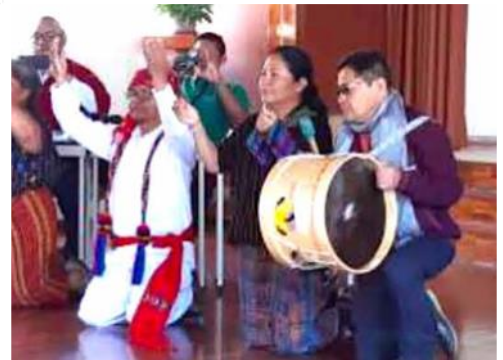
Arriba: Los participantes rezan incorporando elementos de sus culturas.

El objetivo de la reunión era conocerse mejor compartiendo dificultades y esperanzas, y centrarse en el cuidado del hogar común. El proyecto promovió con éxito los objetivos de la confraternidad de apoyar la justicia y los derechos territoriales de las comunidades indígenas. Los fondos proporcionados por la OSV y donantes privados cubrieron los gastos de viaje, alojamiento y comidas de los participantes.